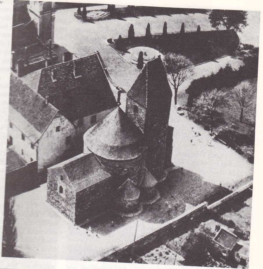
Opactwo Norbertanek z końca XII w. w Strzelnie

◀ Fragment płaskorzeźby z kościoła pw. Narodzenia Marii Panny w Czchowiu, z 1 poł. XII w. (obecnie w Muzeum Narodowym w Krakowie) przedstawiający gryfa atakującego lwa